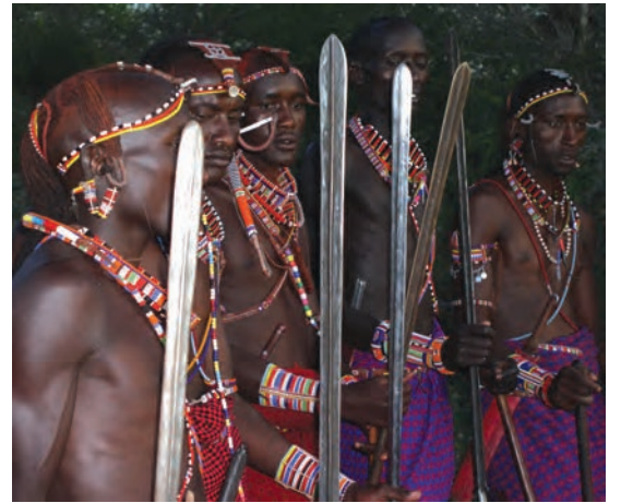
चित्र 16 - योद्धा गहरे लाल रंग की शुका और चमकदार मोतियों के आभूषण पहनते हैं तथा स्टील की नोक वाला पाँच फुट लंबा भाला रखते हैं। बारीकी से सँवारे गए उनके बाल गेरू से रंगे होते हैं। उगते सूरज को सम्मान देने के लिए वे पूर्व की ओर मुँह करके खड़े होते हैं। योद्धा अपने समुदाय की रक्षा करते हैं और लड़के पशुओं को चराते हैं। सूखे के मौसम में योद्धा और लड़के, दोनों ही पशु चराते हैं।

औपनिवेशिक काल में अफ्रीका के बाकी स्थानों की तरह मासाइलैंड में भी आए बदलावों से सारे चरवाहों पर एक जैसा असर नहीं पड़ा। उपनिवेश बनने से पहले मासाई समाज दो सामाजिक श्रेणियों में बँटा हुआ था – वरिष्ठ जन (एल्डर्स) और योद्धा (वॉरियर्स)। वरिष्ठ जन शासन चलाते थे। समुदाय से जुड़े मामलों पर विचार-विमर्श करने और अहम फैसले लेने के लिए वे समय-समय पर सभा करते थे। योद्धाओं में ज़्यादातर नौजवान होते थे जिन्हें मुख्य रूप से लड़ाई लड़ने और कबीले की हिफ़ाज़त करने के लिए तैयार किया जाता था। वे समुदाय की रक्षा करते थे और दूसरे कबीलों के मवेशी छीन कर लाते थे। जहाँ जानवर ही संपत्ति हो वहाँ हमला करके दूसरों के जानवर छीन लेना एक महत्वपूर्ण काम होता था। अलग-अलग चरवाहा समुदायों की ताकत इन्हीं हमलों से तय होती थी। युवाओं को योद्धा वर्ग का हिस्सा तभी माना जाता था जब वे दूसरे समूह के मवेशियों को छीन कर और