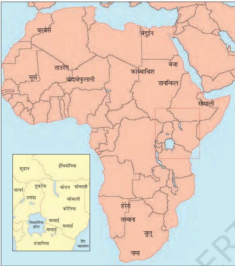
चित्र 13 - अफ़्रीका के चरवाहा समुदाय.

छोटी तस्वीर (इनसेट) में कीनिया और तंज़ानिया में मासाइयों का इलाका दर्शाया गया है।