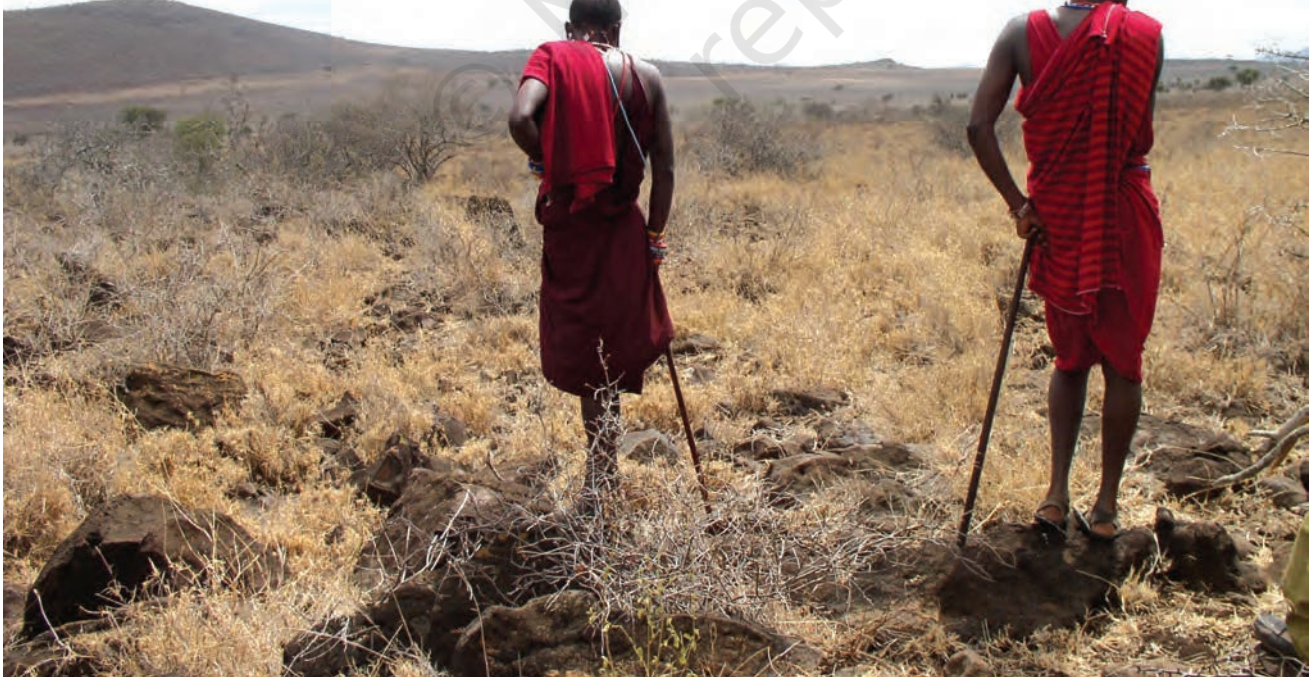
चित्र 14 - घास के बिना पशु (मवेशी, बकरियाँ और भेड़ें) कुपोषण का शिकार हो जाते हैं जिसका मतलब है कि चरवाहों के परिवारों और बच्चों के लिए भोजन कम पड़ने लगता है। सूखे और भोजन की सर्वाधिक कमी से ग्रस्त इलाका अम्बोसेली नैशनल पार्क के आसपास पड़ता है जिसकी पर्यटन से होने वाली आय पिछले साल लगभग 24 करोड़ कीनियन शिलिंग (लगभग 35 लाख अमेरिकी डॉलर) थी। किलिमंजारो जल परियोजना भी इसी इलाके से होकर जाती है लेकिन यहाँ रहने वाले समुदाय न तो पीने के लिए और न ही सिंचाई के लिए इस परियोजना के पानी का इस्तेमाल कर सकते हैं।

बहुत सारे चरागाहों को शिकारगाह बना दिया गया। कीनिया में मासाई मारा व साम्बूरू नैशनल पार्क और तंज़ानिया में सेरेन्गेटी पार्क जैसे शिकारगाह इसी तरह अस्तित्व में आए थे। इन आरक्षित जंगलों में चरवाहों का आना मना था। इन इलाकों में न तो वे शिकार कर सकते थे और न अपने जानवरों को चरा सकते थे। ऐसे बहुत सारे आरक्षित जंगलों में अब तक मासाई अपने ढोर-डंगर चराया करते थे। मिसाल के तौर पर सेरेन्गेटी नैशनल पार्क का 14,760 वर्ग किलोमीटर से भी ज़्यादा क्षेत्रफल मासाइयों के चरागाहों पर कब्ज़ा करके बनाया गया था।