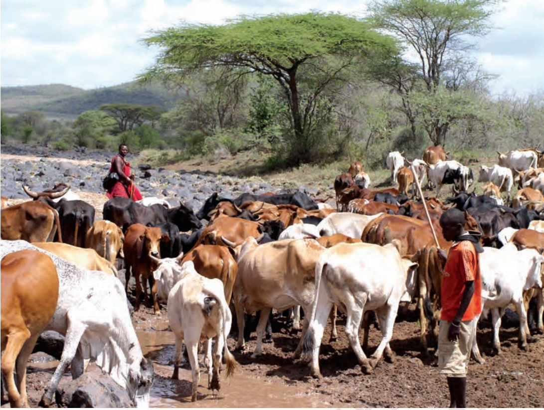
चित्र 15 - मासाई नाम 'मा' शब्द से निकला है। मा-साई का मतलब होता है 'मेरे लोग'। परंपरागत रूप से मासाई घुमंतू और चरवाहा समुदाय के लोग होते हैं जो अपनी आजीविका के लिए दूध और मांस पर आश्रित रहते हैं। ऊँचे तापमान और कम वर्षा के कारण यहाँ शुष्क, धूल भरे और बेहद गर्म हालात रहते हैं। इस अर्ध-शुष्क विषुववृत्तीय इलाके में सूखे के हालात सामान्य हैं। ऐसे समय में बहुत सारे जानवर मर जाते हैं।