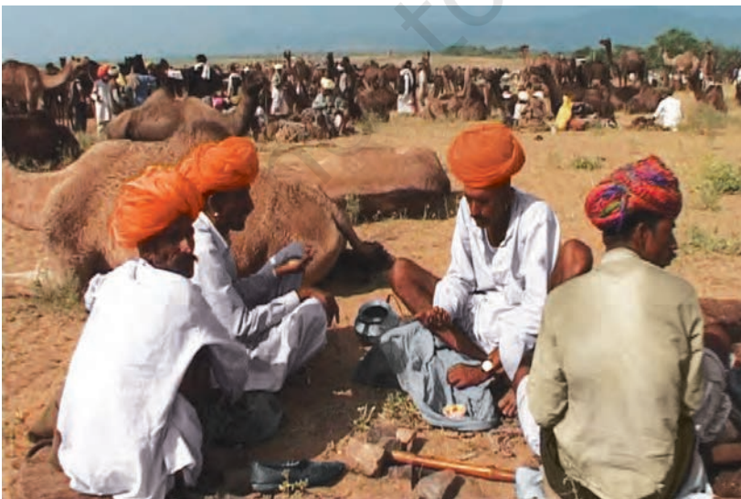
चित्र 8 - पुष्कर का ऊँट मेला.

आइए, अब देखें कि औपनिवेशिक शासन के दौरान यानी अंग्रेज़ों के ज़माने में चरवाहों का जीवन किस तरह बदला?