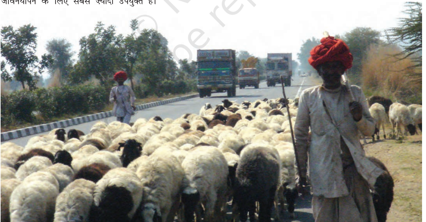
चित्र 18 - जयपुर राजमार्ग पर राइका गड़रिये.

चरवाहे अतीत के अवशेष नहीं हैं। वे ऐसे लोग नहीं हैं जिनके लिए आज की आधुनिक दुनिया में कोई जगह नहीं है। पर्यावरणवादी और अर्थशास्त्री अब इस बात को काफ़ी गंभीरता से मानने लगे हैं कि घुमंतू चरवाहों की जीवनशैली दुनिया के बहुत सारे पहाड़ी और सूखे इलाकों में जीवनयापन के लिए सबसे ज़्यादा उपयुक्त है।