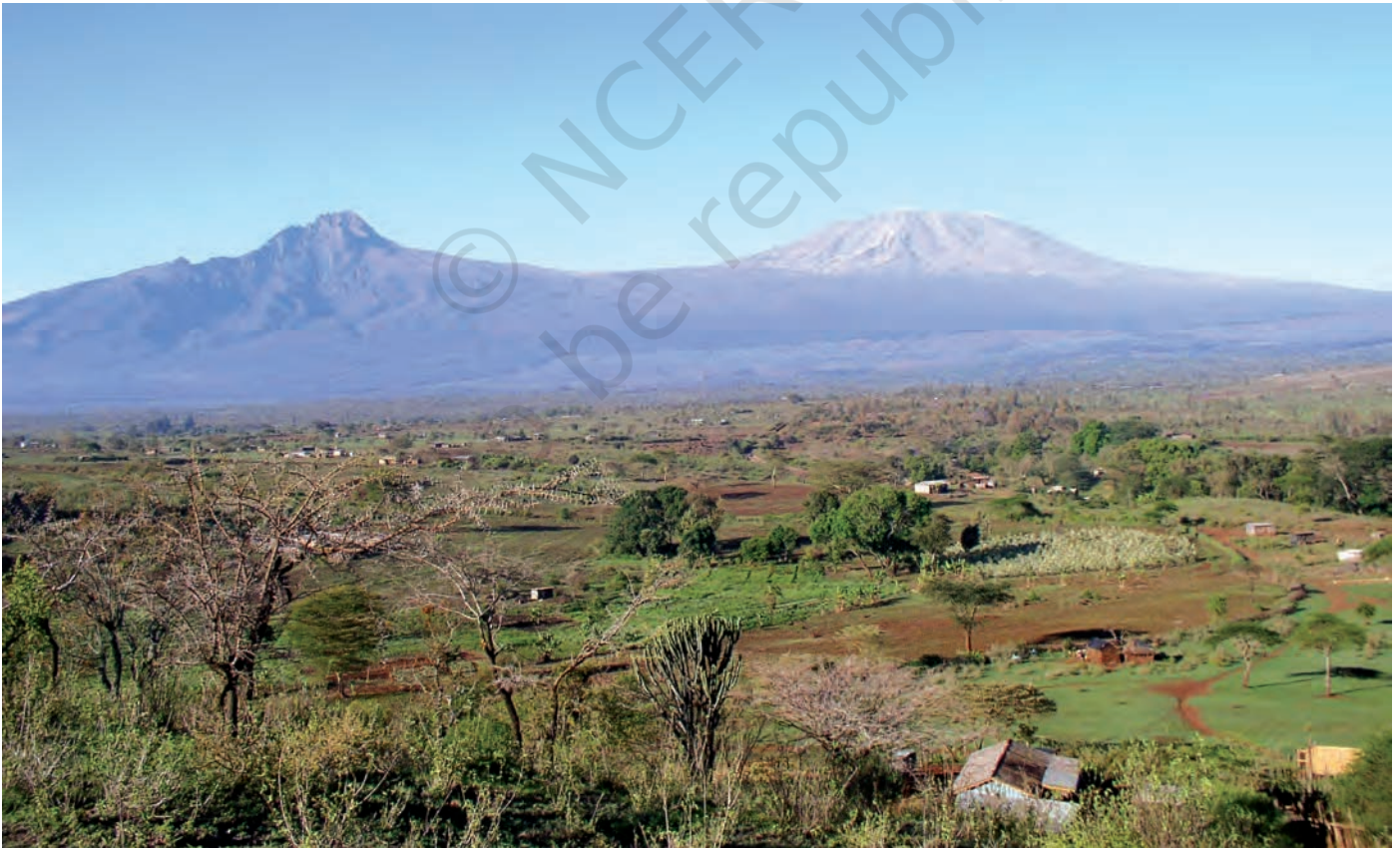
चित्र 12 - मासाई लैंड जिसके पीछे किलिमंजारो पहाड़ दिखाई दे रहे हैं।

हिंदुस्तान की तरह अफ्रीकी चरवाहों की ज़िंदगी में भी औपनिवेशिक और उत्तर-औपनिवेशिक काल में गहरे बदलाव आए हैं। आखिर क्या थे ये बदलाव?