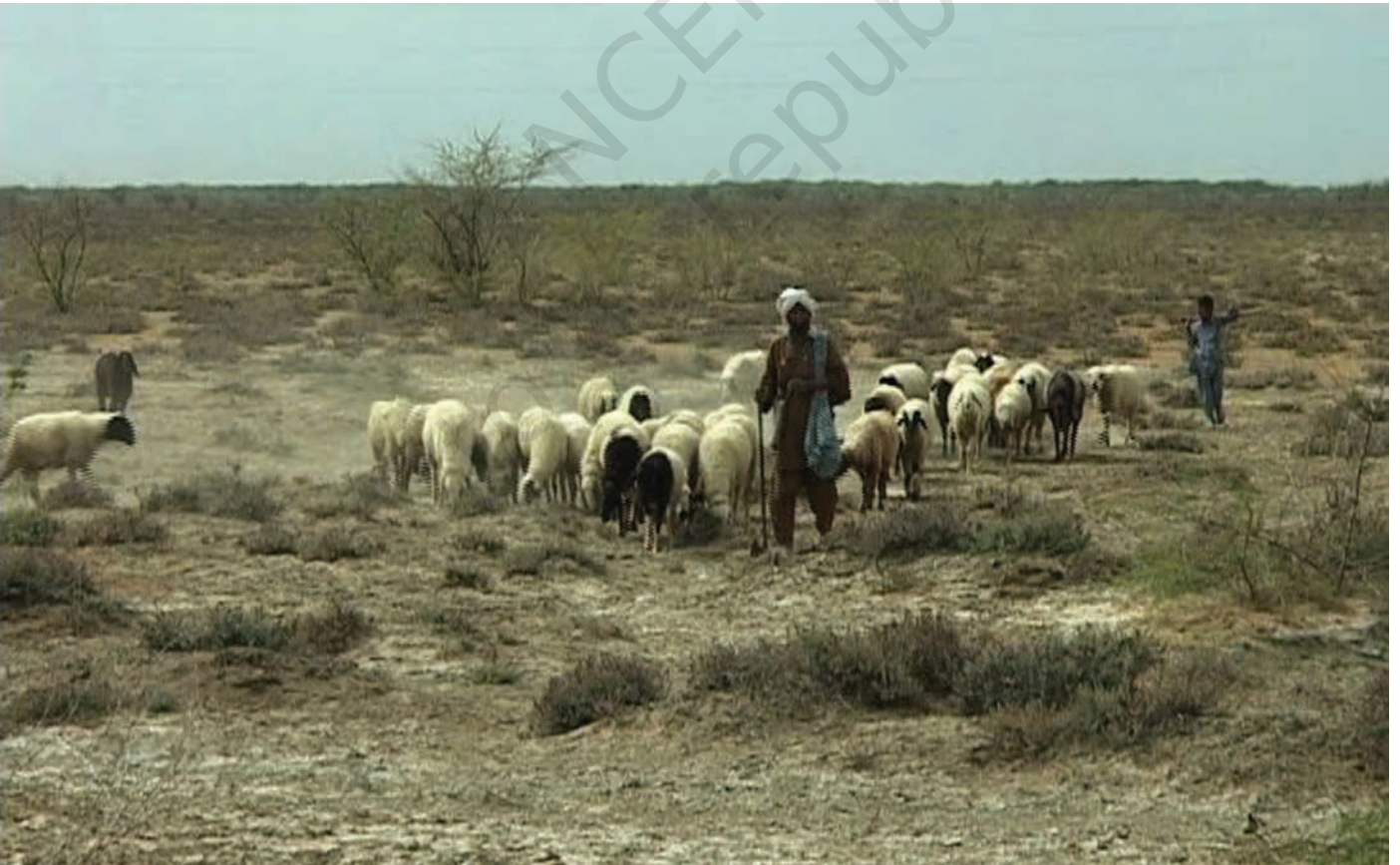
चित्र 10 - चरागाहों की तलाश में निकले मालधारी चरवाहे। उनके गाँव कच्छ की रन में स्थित हैं।

वंशावली बताने वाला समुदाय का इतिहास बताता है। इस तरह की मौखिक परंपराओं से चरवाहा समुदायों को अपनी पहचान का भाव मिलता है। इन परंपराओं से हम यह पता लगा सकते हैं कि कोई समूह अपने अतीत को किस तरह देखता है।