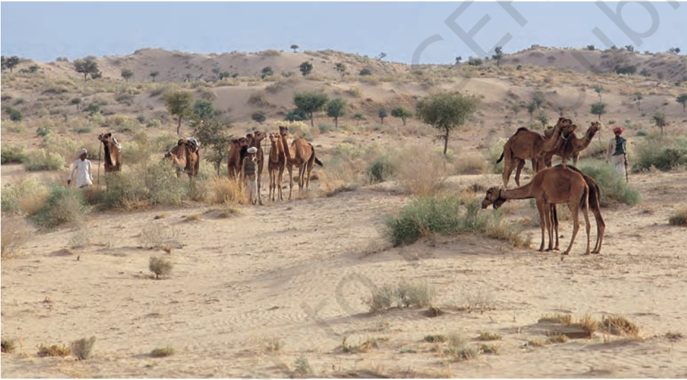
चित्र 5 - पश्चिमी राजस्थान के थार रेगिस्तान में चरते राइका समुदाय के ऊँट.

धंगर महाराष्ट्र का एक जाना-माना चरवाहा समुदाय है। बीसवीं सदी की शुरुआत में इस समुदाय की आबादी लगभग 4,67,000 थी। उनमें से ज्यादातर गड़रिये या चरवाहे थे हालाँकि कुछ लोग कम्बल और चादरें भी बनाते थे जबकि कुछ भैंस पालते थे। धंगर गड़रिये बरसात के दिनों में महाराष्ट्र के मध्य पठारों में रहते थे। यह एक अर्ध-शुष्क इलाका था जहाँ बारिश बहुत कम होती थी और मिट्टी भी खास उपजाऊ नहीं थी। चारों तरफ सिर्फ कंटोली झाड़ियाँ होती थीं। बाजरे जैसी सूखी फ़सलों के अलावा यहाँ और कुछ नहीं उगता था। मॉनसून में यह पट्टी धंगरों के जानवरों के लिए एक विशाल चरागाह बन जाती थी। अक्टूबर के आसपास धंगर बाजरे की कटाई करते थे और चरागाहों की तलाश में पश्चिम की तरफ चल पड़ते थे। करीब महीने भर पैदल चलने के बाद वे अपने रेवड़ों के साथ कोंकण के इलाके में जाकर डेरा डाल देते थे। अच्छी बारिश और उपजाऊ मिट्टी की बदौलत इस इलाके में खेती खूब होती थी। कोंकणी किसान भी इन चरवाहों का दिल खोलकर स्वागत करते थे। जिस समय धंगर कोंकण पहुँचते थे उसी समय कोंकण के किसानों को खरीफ़ की फ़सल काट कर अपने खेतों को रबी की फ़सल के लिए दोबारा उपजाऊ बनाना होता था।