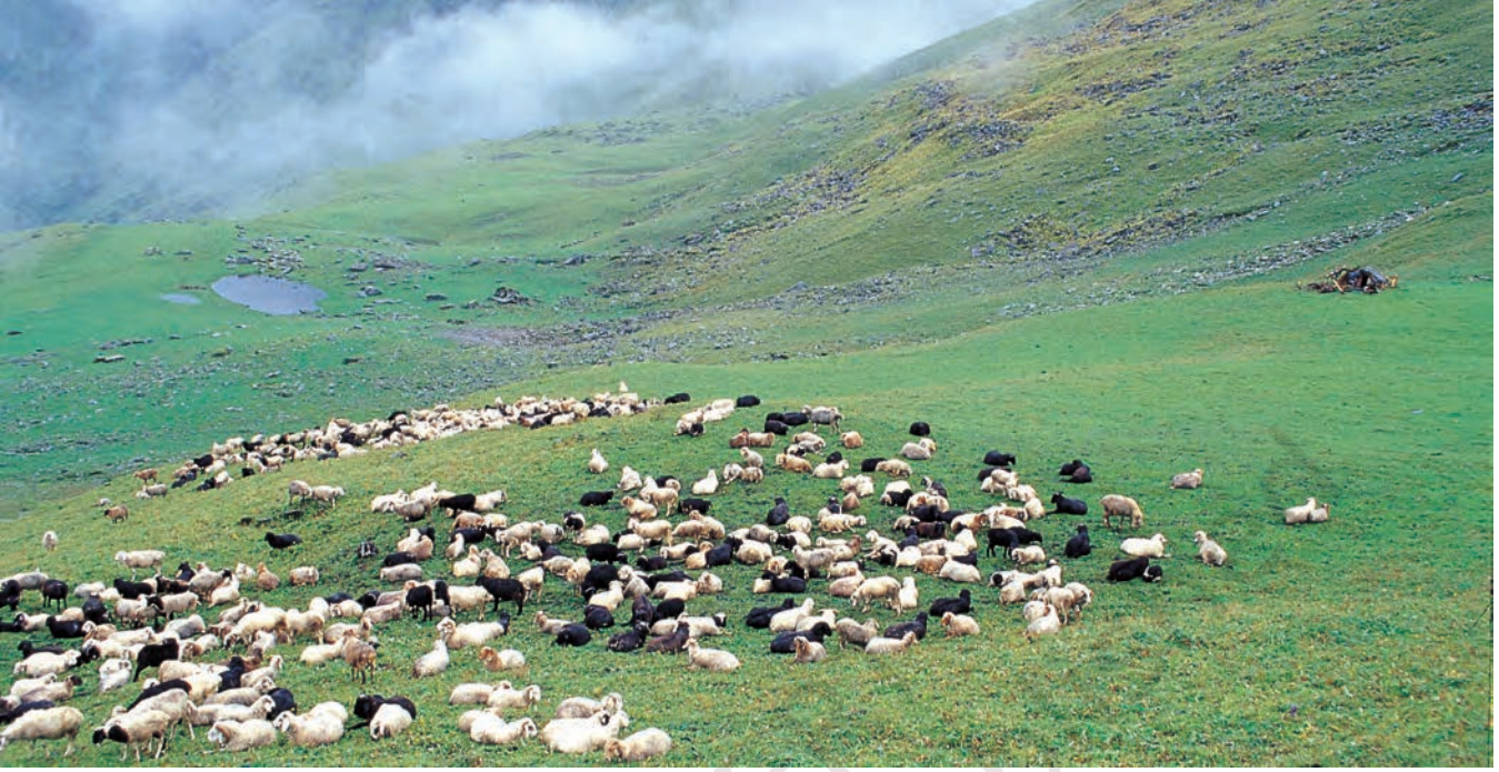
चित्र 1 - पूर्वी गढ़वाल के बुग्याल में चरती भेड़ें।

बुग्याल ऊँचे पहाड़ों पर 12,000 फुट से भी ज्यादा ऊँचाई पर स्थित विशाल प्राकृतिक चरागाह होते हैं। जाड़ों में ये बर्फ से ढके रहते हैं और अप्रैल के बाद हरे-भरे हो जाते हैं। इस समय पहाड़ियों की तलहटी तरह-तरह की घास, जड़ों और जड़ी-बूटियों से भरी रहती है। मॉनसून तक इन चरागाहों में घनी हरियाली छा जाती है और चारों तरफ फूल ही फूल दिखाई देने लगते हैं।