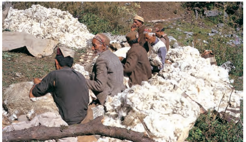
चित्र 4 - गद्दी भेड़ों की ऊन उतार रहे हैं।

भाबर : गढ़वाल और कुमाऊँ के इलाके में पहाड़ियों के निचले हिस्से के आसपास पाए जाने वाला शुष्क या सूखे जंगल का इलाका। बुग्याल : ऊँचे पहाड़ों में स्थित घास के मैदान।