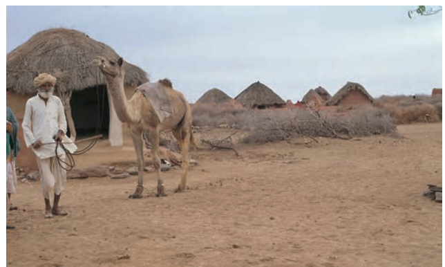
चित्र 6 - अपने ऊँट के साथ एक ऊँटपालक.

यह राजस्थान में जैसलमेर के निकट थार का रेगिस्तान है। इस इलाके के ऊँट पालकों को मारू (रेगिस्तान) राइका और उनकी बस्ती को ढंडी कहा जाता है।