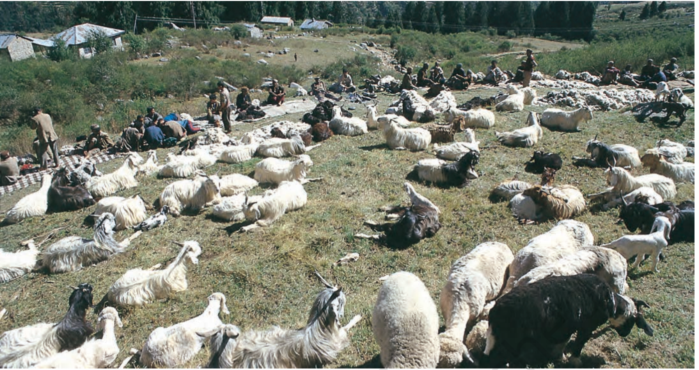
चित्र 3 - ऊन उतारने का इंतज़ार। हिमाचल प्रदेश स्थित पालमपुर के पास उहल घाटी।

और स्पीति के गाँवों में एक बार फिर कुछ समय के लिए रुकते। इस बीच वे गर्मियों की फ़सलें काटते और सर्दियों की फ़सलों की बुवाई करके आगे बढ़ जाते। यहाँ से वे अपने रेवड़ लेकर शिवालिक की पहाड़ियों में जाड़ों वाले चरागाहों में चले जाते और अगली अप्रैल में भेड़-बकरियाँ लेकर वे दोबारा गर्मियों के चरागाहों की तरफ़ रवाना हो जाते।