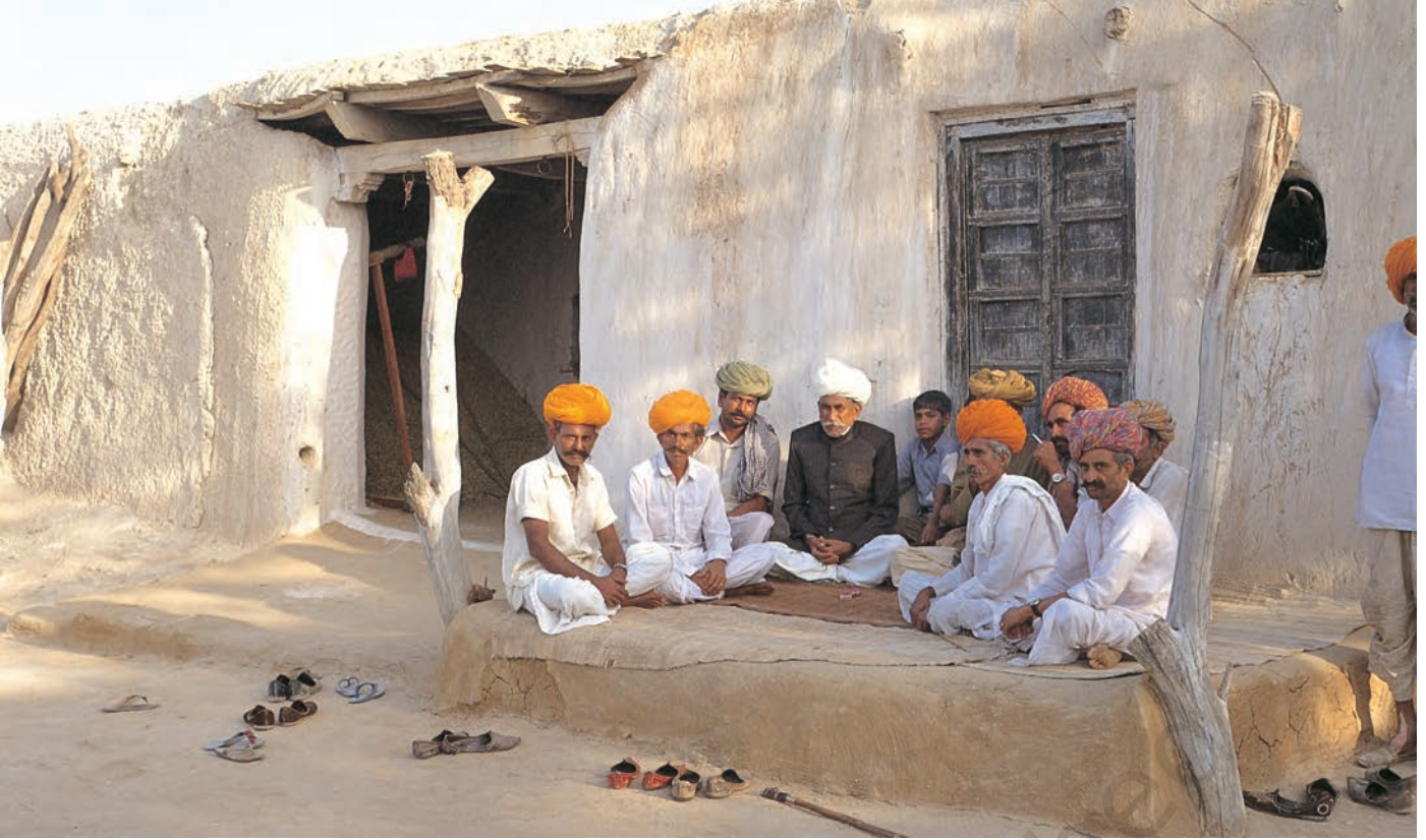
चित्र 9 - मारू राइकाओं की वंशावली बताने वाला.

वंशावली बताने वाला समुदाय का इतिहास बताता है। इस तरह की मौखिक परंपराओं से चरवाहा समुदायों को अपनी पहचान का भाव मिलता है। इन परंपराओं से हम यह पता लगा सकते हैं कि कोई समूह अपने अतीत को किस तरह देखता है।