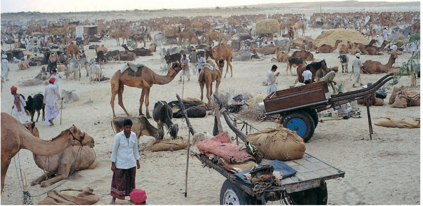
चित्र 7 - पश्चिमी राजस्थान में बलोतरा स्थित ऊँट मेला.

ऊँटपालक यहाँ ऊँटों की खरीद-फ़रोख्त के लिए आते हैं। मेले में मारू राइका ऊँटों के प्रशिक्षण में अपनी महारत का भी प्रदर्शन करते हैं। इस मेले में गुजरात से घोड़े भी लाए जाते हैं।